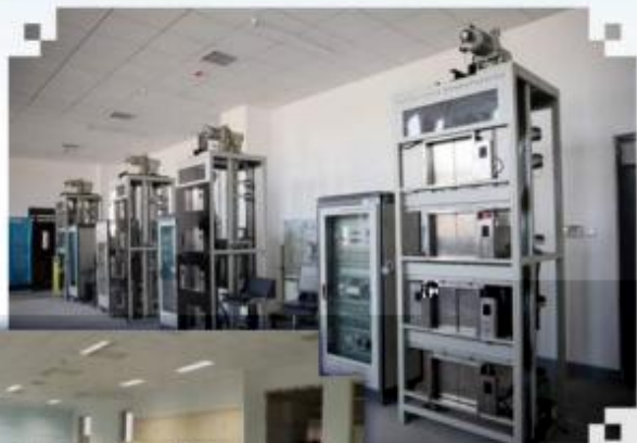
智能电梯安装调试 维护训练场所